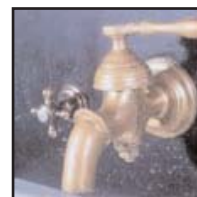
De vakbeurzen in 2003:

De organisatoren van de beurs in Rosmalen verzorgen al jaren een gelijknamige beurs in het Overijsselse Hardenberg. Op deze beurs, van 16 tot en met 18 september, richt de RCI Overijssel dit jaar voor de vijfde keer een Opleidingsplein in. Een lustrum. De vakbeurzen vormen een mooie gelegenheid om collega's en relaties te ontmoeten. De informele sfeer wordt onderstreept door de nodige hapjes en drankjes die op de beursvloer verkrijgbaar zijn.