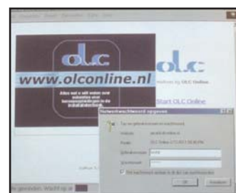
Het nieuwtje van OLC: www.online.nl

OLC Online is vanaf elke moderne computer met internet-aansluiting te gebruiken. Maar bedrijven kunnen ook op de ouderwetse manier hun scholingssubsidies regelen. "Internet is handig, maar daarmee verdwijnen de traditionele post en telefoon niet als communicatiemiddel", aldus OLC.