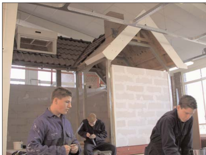
Vmbo-4-leerlingen bij het huis in aanbouw in het Canisius College. Binnen twee maanden moet het huis gereed zijn om er de echte installatiepraktijk te simuleren.