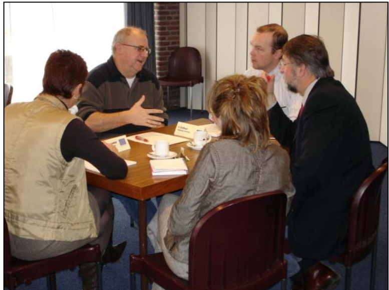
De eerste bedrijfsontmoeting "Slimmer leren van en met elkaar" op 22 februari bij Bouwhof Citadel in Rijssen leidde tot diepgaande groepsdiscussies.

De bijeenkomsten op woensdag 23 maart (13.30 - 16.30 in Rijssen), donderdagochtend 24 maart (9.00-12.00 in Elst Gld) en dinsdagmiddag 29 maart (13.30 - 16.30 uur in Doetinchem) zijn vooral bedoeld voor de grote(re) bedrijven; de avond op 29 maart (19.30 - 21.30) in Doetinchem is meer voor de kleine(re) bedrijven.