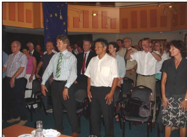
Bij de officiële start van “Slimmer Scholen” in juni 2005 (manipuleerde een Belgische “professor” de aanwezigen om buiten bestaande kaders te denken...

Gedurende het eerste projectjaar leerde een aantal “Slimmer Scholen”-bedrijven veel van elkaar tijdens zogenoemde bedrijfsontmoetingen. Hieruit is een “denktank” ontstaan van middelgrote bedrijven die ondersteund door het scholingsfonds OTIB ook nu nog met regelmaat elkaar ontmoet. Op basis van eigen ervaringen werkt deze “Denktank Slimmer Scholen” aan aanbevelingen ( good practices ) waar vooral de middenbedrijven in de technische installatiebranche profijt van kunnen hebben.