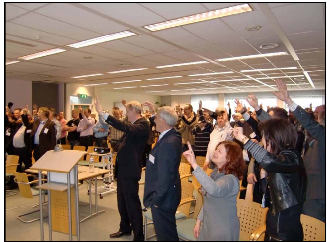
... actief meedoen tijdens de werkconferentie ...

Tijdens de werkconferentie, waar Kenteq als gastheer de uitstekende catering verzorgde, konden de bezoekers aan de slag in zes workshops. In elke workshop stond een onderwerp uit het Masterplan centraal. Dit liep uiteen van de mogelijkheid voor bedrijven om zich te onderscheiden als Excellent Opleidingsbedrijf, via het werken