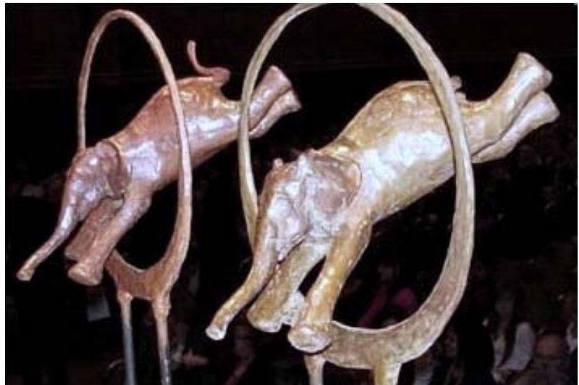
Hierboven de bronzen trofee waarvan er één bestemd is voor de winnaar van de Nationale Innovatieprijs Beroepsonderwijs 2012. Grote vraag (om van te dromen): mocht het Masterplan winnen, waar komt dit prachtbeeld dan te staan?

"Kijkend naar de grote betrokkenheid en inmiddels structurele samenwerking van ROC's, bedrijven en brancheorganisaties in Zuid-Holland, kijkend naar de bedrijvenkringen rondom de ROC's, kijkend naar de ontwikkeling van uniforme wijzen van begeleiding, beoordeling en exami-