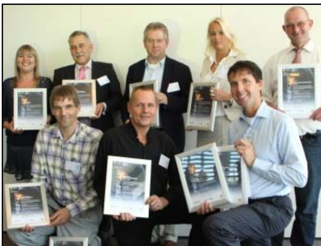
Het in ontvangst nemen van de branchepredicaten "Excellent Opleidingsbedrijf" ging 30 september gepaard met een uitgebreide fotosessie.