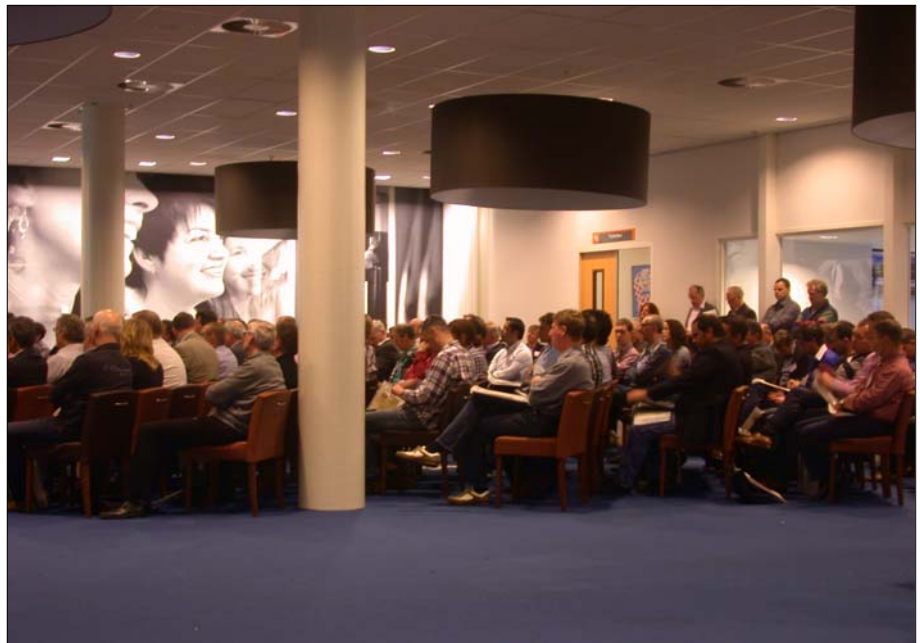
De belangstelling voor de tweede Werkconferentie van het succesrijke Samenwerkingsproject CGO Gelderland-Overijssel was groot. Tijdens de opening moesten sommige bezoekers zelfs blijven staan.

Met 110 medewerkers van bedrijven, ROC's en Kenteq is er het afgelopen jaar gewerkt aan het onderwijs voor de regio en dat werd met verve uitgedragen in de diverse workshops. De heftigheid van diverse discussies onderstreepte de grote mate van betrokkenheid. Naar aanleiding van de Werkconferentie hebben verschillende bedrijven zich bij het projectmanagement gemeld om ook mee